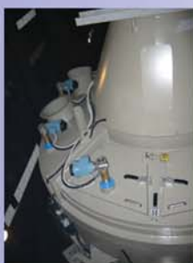
Impianto di lavaggio automatico a teste rotanti retrattili