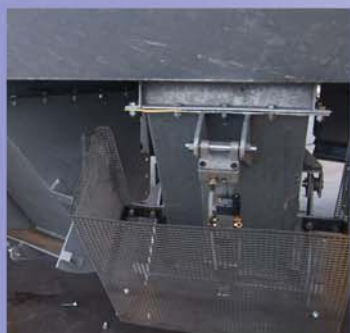
Particolare delle bocchette di dosaggio