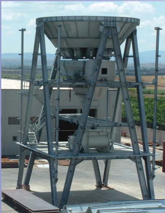
Struttura, scomparti e tramoggia inerti, bocchette, passerelle, scale, ecc.. ZINCATI A CALDO